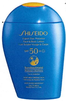
Hightech „Expert Sun Protector Face & Body Lotion SPF 50+“ von SHISEIDO