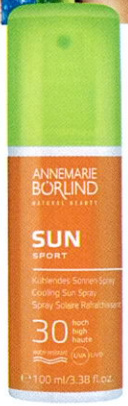
Cool down „Sun Sport LSF 30“ von ANNEMARIE BÖRLIND