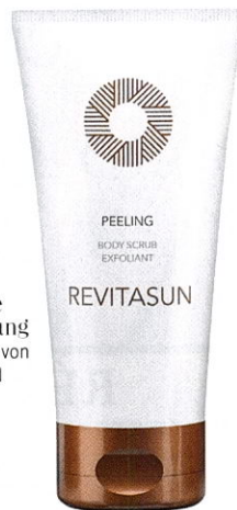
Perfekte Vorbereitung „Body Scrub“ von REVITASUN