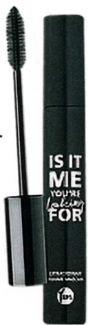
Volumen-Wunder „Extraordinary Volume Mascara“ von YBPN