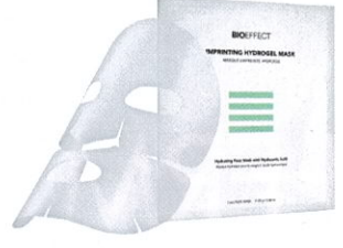
Pure Erfrischung „Imprinting Hydrogel Mask“ von BIOEFFECT