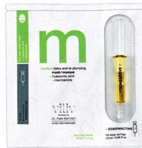
Schnell erholt „Modern detox and replumping mask“ von VILIV