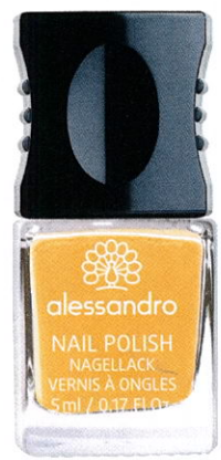
Leuchtend „Hanging in Honolulu“ von ALESSANDRO