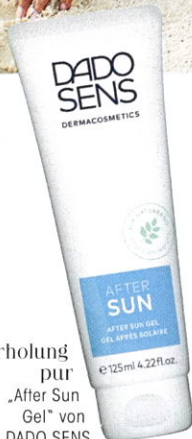
Erholung pur „After Sun Gel“ von DADO SENS