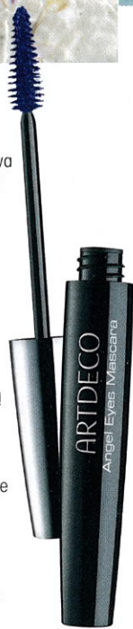
Cool betont „Angel Eyes Mascara Azur“ von ARTIDECO