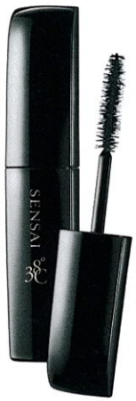
Sicherer Halt „Mascara 38° C Lash Volumiser“ von SENSAL