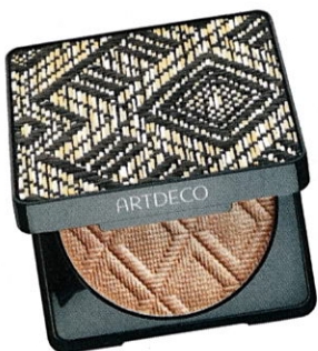
Natürlich „Summer Glow“ von Artdeco