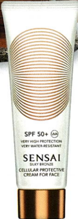
Umfassend „Silky Bronze Cellular Protective Cream for Face SPF 50+“ von SENSAI