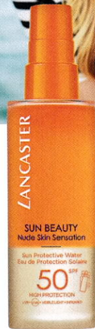
Gespritzt! „Sun Beauty Nude Skin Sensation Sun Protective Water SPF 50“ von LANCASTER